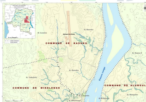
Figure n° 02 : Carte politique de la Ville de Kindu (Mairie de la ville)

La population de la ville de Kindu est une mosaïque de peuples composée d'une population hétérogène et est estimée à 618.516 habitants pour l'année 2022.